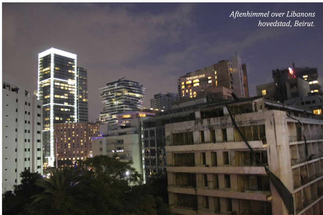
Aftenhimmel over Libanons hovedstad, Beirut.

Behovet for måltider og socialhjælp stiger stadig. Bed om flere givere.