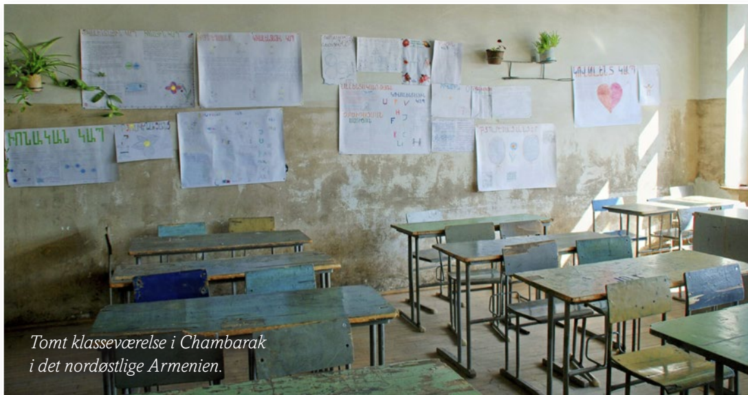
Tomt klasseværelse i Chambarak i det nordøstlige Armenien.

mindste klasser, og undervisningen vil foregå i små grupper.