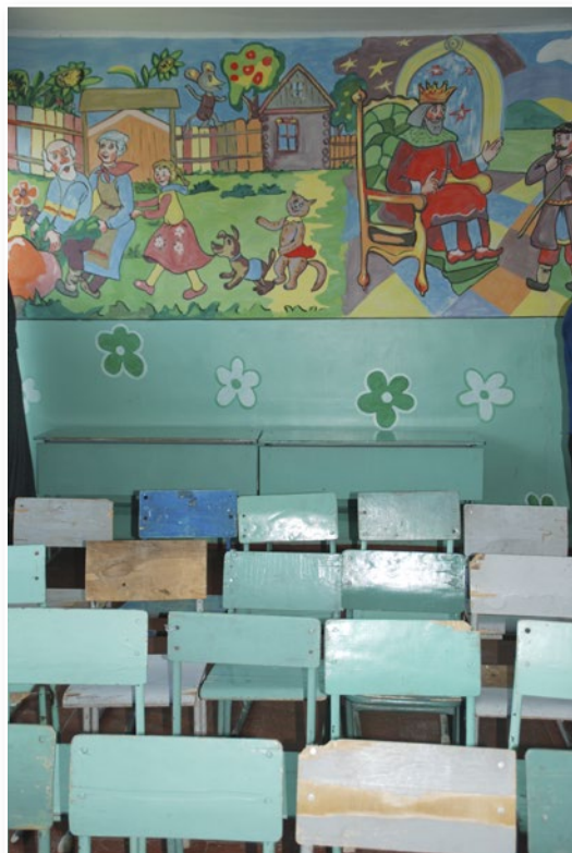
Tomt klasseværelse i Chambarak i det nordøstlige Armenien.

Børnene er meget opmærksomme på smittefaren, men lærer at leve med risikoen for at blive smittet.