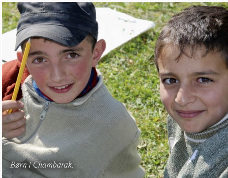
Børn i Chambarak.

Mine børn har haft det svært og har været psykisk påvirket af Corona-situationen. Det har været en tid med mange afsavn.