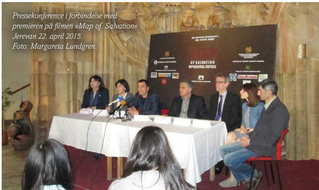
Pressekonference i forbindelse med premieren på filmen »Map of Salvation« Jerevan 22. april 2015.