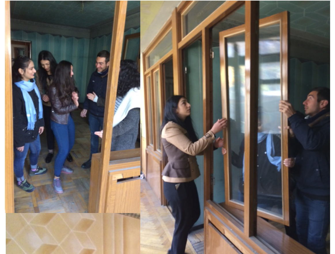
Lejligheden vil være det perfekte samlingssted for ungdomsgruppen.

I løbet af de næste måneder vil lejligheden blive sat grundigt i stand, og herefter kan den tages i brug af ungdomsgruppen, søndagsskolen for handicappede børn og blive brugt til møder og undervisning for søndagsskolelærerne i Light to Kids-projektet.