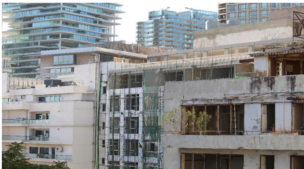
Ruiner og nye skyskrabere side om side i Beirut