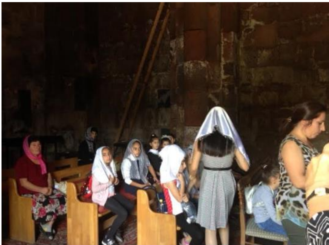
2 Indtryk fra arrangementet i kirken

Katolikosen, kirkens øverste leder, lovede DAM, at hvis vi kunne skaffe penge til renovering af kirken, ville han spendere en præst, der kunne gøre tjeneste dér og bo i byen. Det har nu fungeret i 20 år. Kirken står der, præsten er der, og han tager imod os, når vi kommer. Det oplevede vi midt i september 2019. Han holder en liturgisk andagt for os og fortæller lidt om sognet og søndagsskolen, som har været der i nogle år. Vi danske får lov til at synge en salme, og vi giver præsten en gave til den lokale søndagsskole.