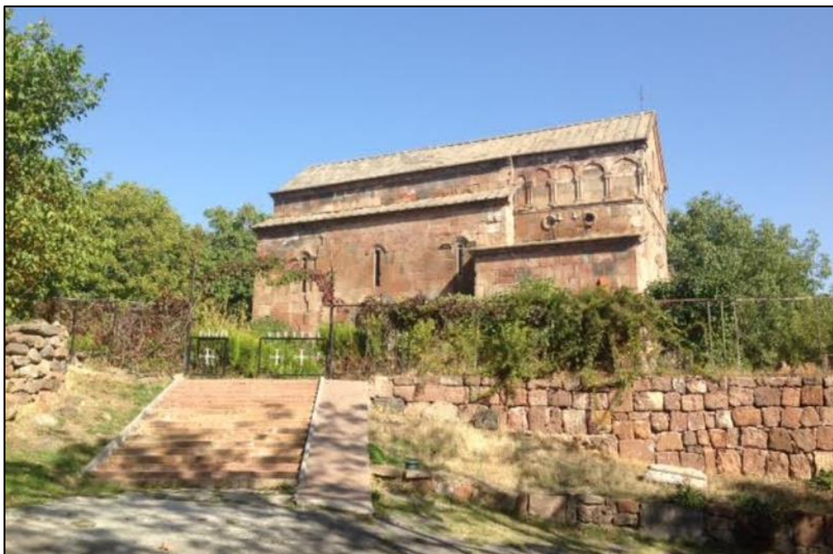
1 Kirken i Byurakan

Da Dansk Armeniermission i midten af 90'erne gerne ville starte et arbejde til støtte for den gamle ortodokse armenske kirke, som havde lidt hårdt under kommunistisk sovjetisk styre i 70 år, foreslog den øverste ledelse i kirken, at vi skulle samle penge ind til at renovere den gamle kirke i Byurakan.